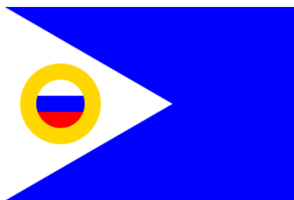
Флаг Чукотского автономного округа