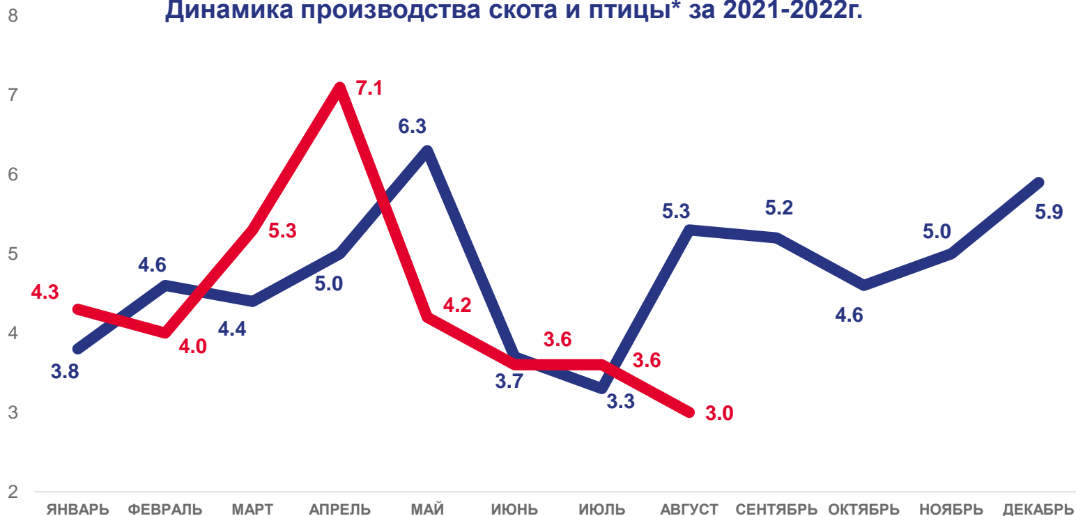
Динамика производства скота и птицы* за 2021-2022г.